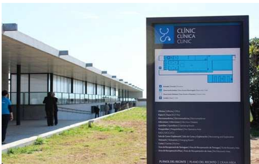
L'edifici de la clínica acull les sales d'operacions i cures i els tancs de recuperació.

El centre neuràlgic de les noves instal·lacions és l'àrea de cures i de clínica, que inclou sales de raigs X, quiròfans, ecògrafs i altres aparells que permetran treballar als veterinaris en el diagnòstic i cura dels casos que se'ls presentin. També s'hi troben els tancs d'aigua salada amb parets de vidre on els pacients podran viure mentre es recuperin. L'objectiu és tractar els exemplars arribats al centre i reintroduir-los al mar en el menor temps possible, malgrat que hi ha pacients que no podran tornar a ser alliberats per la gravetat de les seves ferides i es quedaran a viure al CRAM.