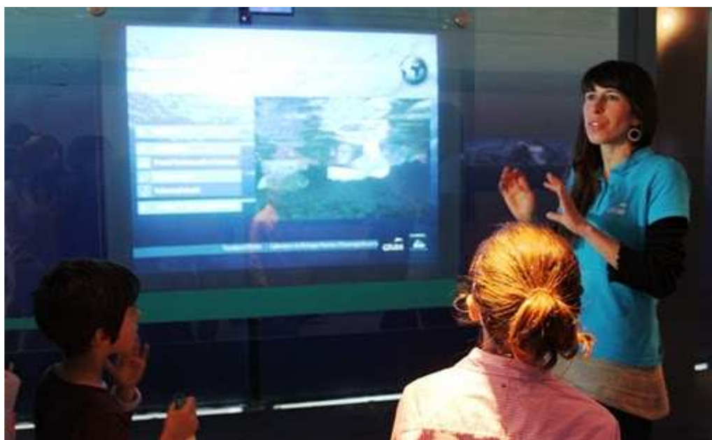
Una de les guies explica els problemes als quals ha de fer front la fauna marina.

A banda de la clínica i de l'àrea de cures, el nou CRAM té un edifici destinat a l'educació, amb diversos panells interactius i una sala de projecció d'audiovisuals sobre les problemàtiques que afecten els nostres mars i oceans, des de la contaminació fins a la sobreexplotació pesquera en algunes zones del planeta. El coneixement d'aquests problemes permet els alumnes i les famílies que visiten el centre analitzar en quina mesura podem ajudar a conservar els ecosistemes marins i la seva biodiversitat. Les visites són guiades pels educadors del centre, amb els quals es realitza un circuit per totes les instal·lacions, des de la clínica i els tancs de recuperació fins a les sales d'audiovisuals. Una pineda amb taules de pícnic convida al descans després de l'itinerari. Desitgem molta sort als membres del CRAM en la seva nova ubicació i