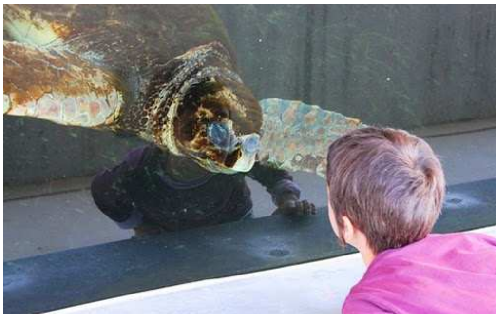
Algunes tortugues, com la de la imatge, es mostren curioses amb els visitants.